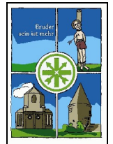
Bezirksverband Mönchengladbach- Korschenbroich